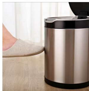
Рис. Датчик удара. Реализован как дополнительная функция открытия верхней крышки без использования рук. Удар может быть произведен ногой, и нет в необходимости в сильном ударе, достаточно лишь легкого прикосновения в середину корпуса мусорного ведра.

*Модель JАН9313, JАН9314- без внутреннего ведра